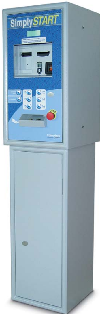
Versione con armadietto

Per gestire l'intero impianto con una sola ed unica centrale di pagamento.